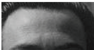
Allemagne - on a rien à dire ! Perfekt !