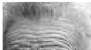
Italie - forts replis des troupes au sud.